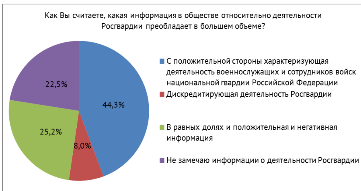
Рисунок 3 – Распределение ответов на вопрос: «Как Вы считаете, какая информация в обществе относительно деятельности Росгвардии преобладает в большем объеме?» (данные анкетного опроса «Общественное доверие населения к Росгвардии») (в % к опрошенным n = 713 )

Таким образом, результаты проведенного анализа свидетельствуют о наличии проблемы, заключающейся в недостаточности удовлетворения запроса российских граждан по вопросу гарантий предоставления им достоверной социально значимой информации, а также открытости и освещенности деятельности Росгвардии. Однако несмотря на активно развивающуюся на сегодняшний день концепцию единой цифровой среды интернет-сайтов государственных органов, посещение данных сайтов уступает по количеству другим ресурсам развлекательного,