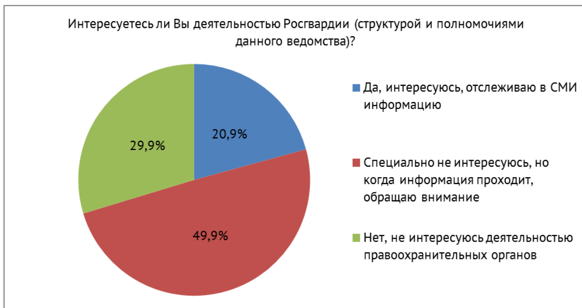
Рисунок 1 – Распределение ответов на вопрос: «Интересуетесь ли Вы деятельностью Росгвардии (структурой и полномочиями данного ведомства)?» (данные анкетного опроса «Общественное доверие населения к Росгвардии») (в % к опрошенным, n = 713)

Респондентам было также предложено ответить на вопрос «Как Вы считаете, какая ин-