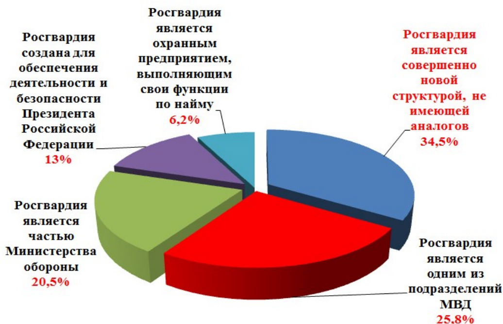
Рисунок 2 – Распределение ответов на вопрос: «Как бы Вы охарактеризовали статус Росгвардии?» (данные анкетного опроса «Общественное доверие населения к Росгвардии») (в % к опрошенным n = 713)

эффективной, большую часть респондентов составили те, кто слышал об этом, но до сих пор относил их к подразделениям МВД Российской Федерации (31,3 %), оставшаяся часть опрошенных представлена лицами, не имеющими четкого представления о деятельности данных подразделений (15,5 %), впервые услышавшие эти аббревиатуры (4,4 %). Таким образом, анализируя данные показатели, можно констатировать, что более трети опрошенных граждан, наблюдая и оценивая деятельность указанных подразделений Росгвардии, будет ошибочно формировать свое отношение к МВД России, а не к войскам национальной гвардии.