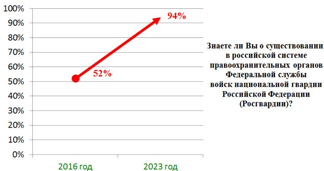
Рисунок 1 – Изменение показателей уровня осведомленности граждан о существовании в российской системе правоохранительных органов Федеральной службы войск национальной гвардии Российской Федерации за период 2016–2023 гг.

Результаты анкетного опроса показали, что около половины опрошенных граждан (48,8 %) знают о вхождении подразделений СОБР и ОМОН в состав Росгвардии и считают их работу