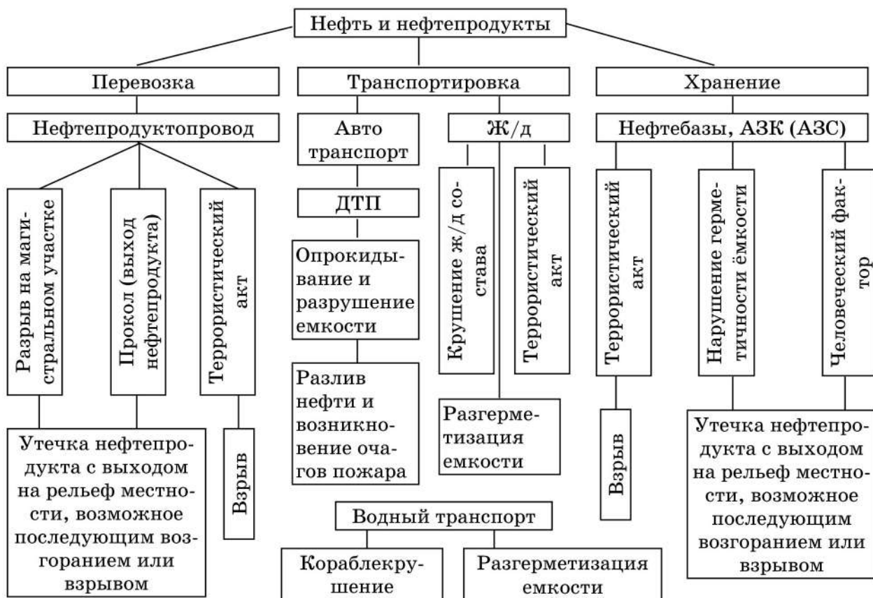
Рисунок 1 – схема ситуационной модели наиболее опасных чрезвычайных ситуаций, связанных с выбросом нефтепродуктов