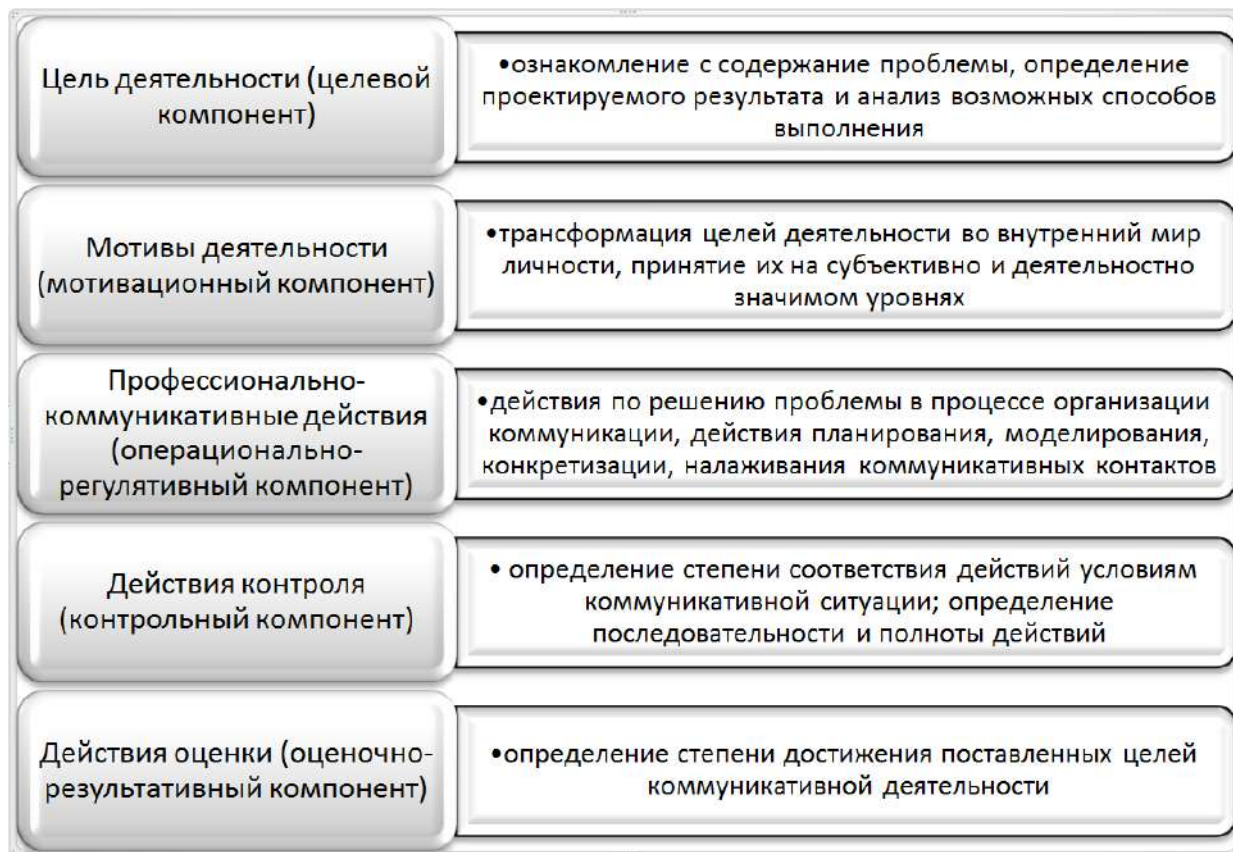
Рисунок 1 – Структура коммуникативной деятельности офицеров ВНГ РФ