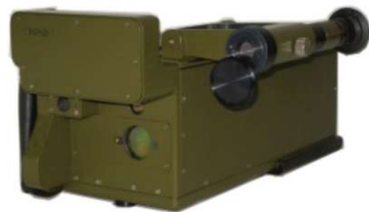
Рисунок 5 – Прибор химической разведки дистанционного действия ПХРДД-3

Пороговая чувствительность по МОВ-1, мг/м^3 – не более 150.