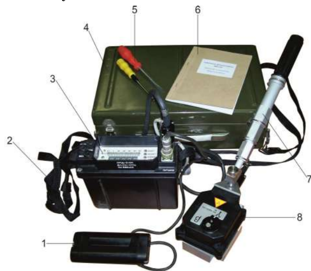
Рисунок 1 – Измеритель мощности дозы ИМД-2НМ: 1 – футляр батарейный; 2 – ремень; 3 – пульт измерительный; 4 – ящик для переноски; 5 – ЗИП; 6 – документация; 7 – штанга удлинительная; 8 – блок детектирования

Измеритель мощности дозы ИМД-2НМ (рис. 1) предназначен для ведения радиационной разведки пешим порядком, а также для измерения степени радиоактивного загрязнения объектов военной техники по бета-излучению.