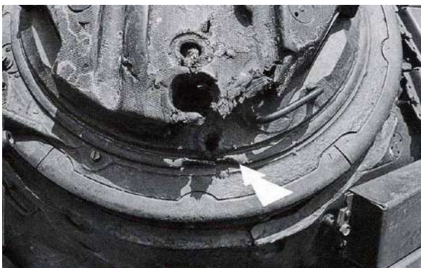
Рисунок 1 – Попадание гранаты РПГ в командирскую башенку Т-72Б1 пробило броню и поразило командира танка. Грозный. Январь 1995 г.

Танки сразу же подвергались обстрелу из нескольких ручных противотанковых гранатометов с различных направлений, как только производили первый выстрел (рис. 1).