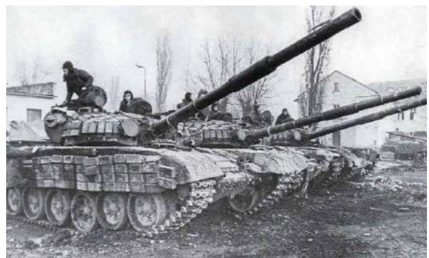
Рисунок 3 – Т-72Б1 2-й танковой роты 276 мсп перед выходом на поддержку своих подразделений

Практически не применялся и оказался абсолютно забыт и этот опыт ведения боев. Совершенно необоснованно российские войска отдали инициативу незаконным вооружённым формированиям. Внутренние войска перешли к обороне вместо того, чтобы постоянно осуществлять зачистки в городе, используя превосходство в огневой мощи своих штурмовых групп (рис. 3).