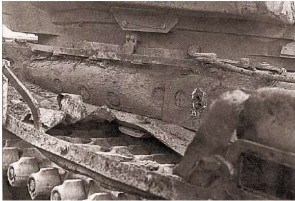
Рисунок 4 – Наличие ящиков ЗИП спасло Т-72Б1 от попадания кумулятивной струи в моторное отделение и соответствующих последствий

Также были случаи, когда танк выдерживал около 20 попаданий снарядов (рис. 4).