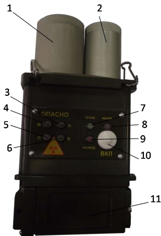
Рисунок 4 – Блок индикации: 1 – преобразователь концентрации ионизационный; 2 – преобразователь концентрации; 3, 4, 5, 6 – светодиоды «Опасно» (А – о наличии паров аммиака, Х – о наличии паров хлора, Ф и Л – о наличии отравляющих веществ); 7 – светодиод «Готов» сигнализации готовности блока индикации; 8 – светодиод «Контр» сигнализации проверки блока индикации; 9 – светодиод «Разряд» сигнализации о разряде аккумулятора; 10 – кнопка включения-выключения блока индикации; 11 – крышка блока питания

Принцип действия: блок индикации (рис. 4) состоит из ионизационного преобразователя концентраций на основе четырехэлектродной ионизационной камеры, работающей на переменном напряжении, предназначенной для обнаружения фосфоорганических отравляющих веществ и электрохимического детектора для обнаружения люизита и аварийно химически опасных веществ типа аммиак и хлор. Источник ионизации ИПК на основе Pu^{238} [6, с. 7].