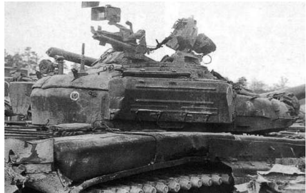
Рисунок 2 – Отсутствие защиты кормы башни в виде ящика ЗИП привело к пробитию брони и гибели командира танка в бою за Грозный. Январь 1995 г.

Как именно надо было действовать в подобных случаях, показали такие города, как Кенигсберг, Браслав и Берлин.