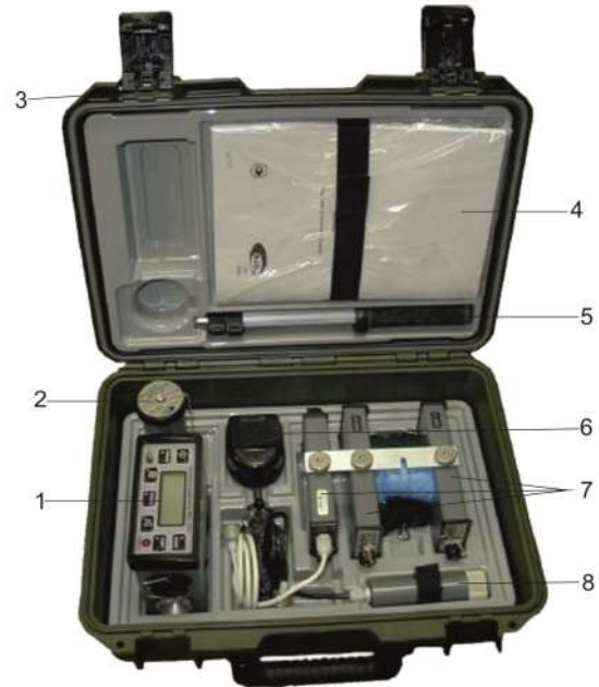
Рисунок 2 – Измеритель мощности дозы ИМД-7Н: 1 – измерительный блок; 2 – (пульт) блок детектирования БДПА-07; 3 – укладочный футляр; 4 – руководство по эксплуатации, формуляр; 5 – штанга телескопическая; 6 – адаптер внешний сетевой; 7 – блок детектирования БДКС-07; 8 – батарейный отсек

го прибора с целью оперативного дозиметрического контроля радиационной обстановки и для обнаружения радиоактивного загрязнения различных военных объектов, продуктов питания и различных поверхностей.