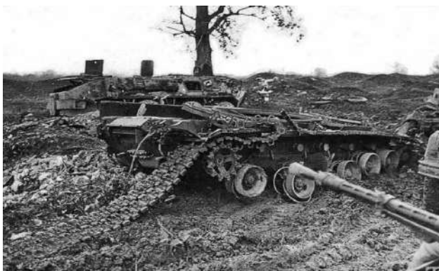
Рисунок 6 – Сгоревший в боях за Грозный танк Т-80Б и КШМ Р-145. Январь 1995 г.

Подводя итог хотелось бы обратить внимание на то, что основное количество танков, боевых машин пехоты и бронетранспортеров внутренних войск было уничтожено с использованием гранатометов и противотанковых гранат. У каждого подбитого танка или бронетранспортера обнаруживали в среднем 5–6 поражающих попаданий. В основном чеченские боевики поражали двигатели и топливные баки. На них приходилось 90 % поражающих попаданий. К примеру, у боевой машины пехоты слабо бронирована крыша, а баки с топливом находятся в задних дверях, также легко уязвим сам водитель. Бронетранспортер уязвим в тех же местах, что и боевая машина пехоты. В ходе боев в Грозном, в первый месяц боевых действий было уничтожено 62 танка подразделений внутренних войск. Было уничтожено попаданиями в незащищенный корпус бронетехники, где отсутствовала динамическая защита, свыше 98 % (то есть 61 танк). У танков Т-72 и Т-80, которые применялись в Чечне, лобовая проекция хорошо бронирована и прикрыта динамической защитой, поэтому они были неуязвимы для фронтальных попаданий. Но их все же можно было уничтожить попаданиями в крышу, борта, заднюю часть, в люк механика-водителя. В начальной стадии конфликта большинство танков, участвовавших в боях, не имело никакой защиты. Поэтому они были особенно уязвимы для фронтальных попаданий (рис. 6).