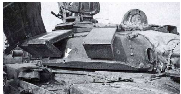
Рисунок 5 – Т-72Б (М) 74 гв. омсбр, пораженный выстрелом из РПГ

Танки и бронетранспортёры, входящие в состав колонны внутренних войск, как правило, двигались с минимальным пешим прикрытием или вообще без него и имели смешанный характер. Это явилось следствием нехватки личного состава. Как показали дальнейшие боевые действия, эти колонны были полностью уничтожены (рис. 5).