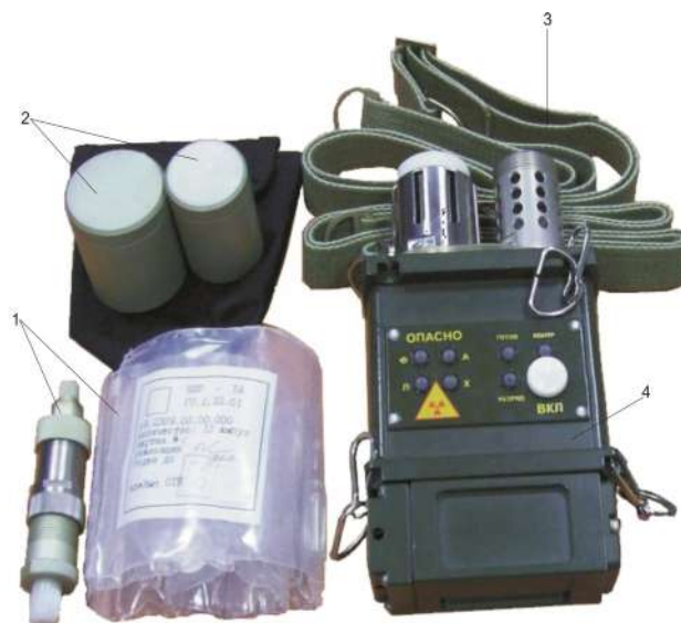
Рисунок 3 – Газосигнализатор войсковой автоматический ГСА-3: 1 – комплект ЗИП-О; 2 – колпаки; 3 – ремни; 4 – блок индикации

Газосигнализатор войсковой автоматический ГСА-3 (рис. 3) предназначен для обнаружения в воздухе паров отравляющих веществ типа зарин, зоман, Ви-экс, люизита, хлора, аммиака и автоматического светового и звукового оповещения об опасности.