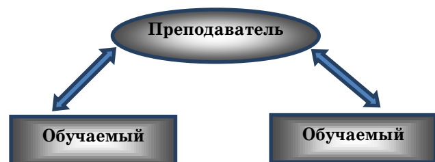
Рисунок 1 – Активная форма обучения

В процессе активных форм обучения происходит взаимодействие курсантов и преподавателя (рис. 1).