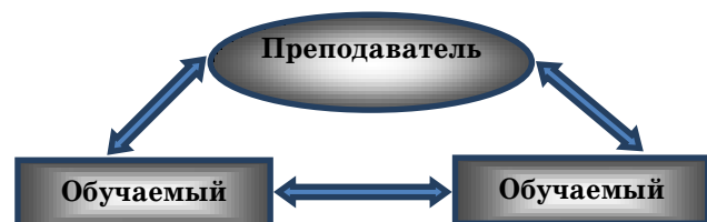
Рисунок 2 – Интерактивная форма обучения

При применении интерактивных форм обучения, происходит не только процесс взаимодействия преподаватель – курсант, но и курсант – курсант (рис. 2).