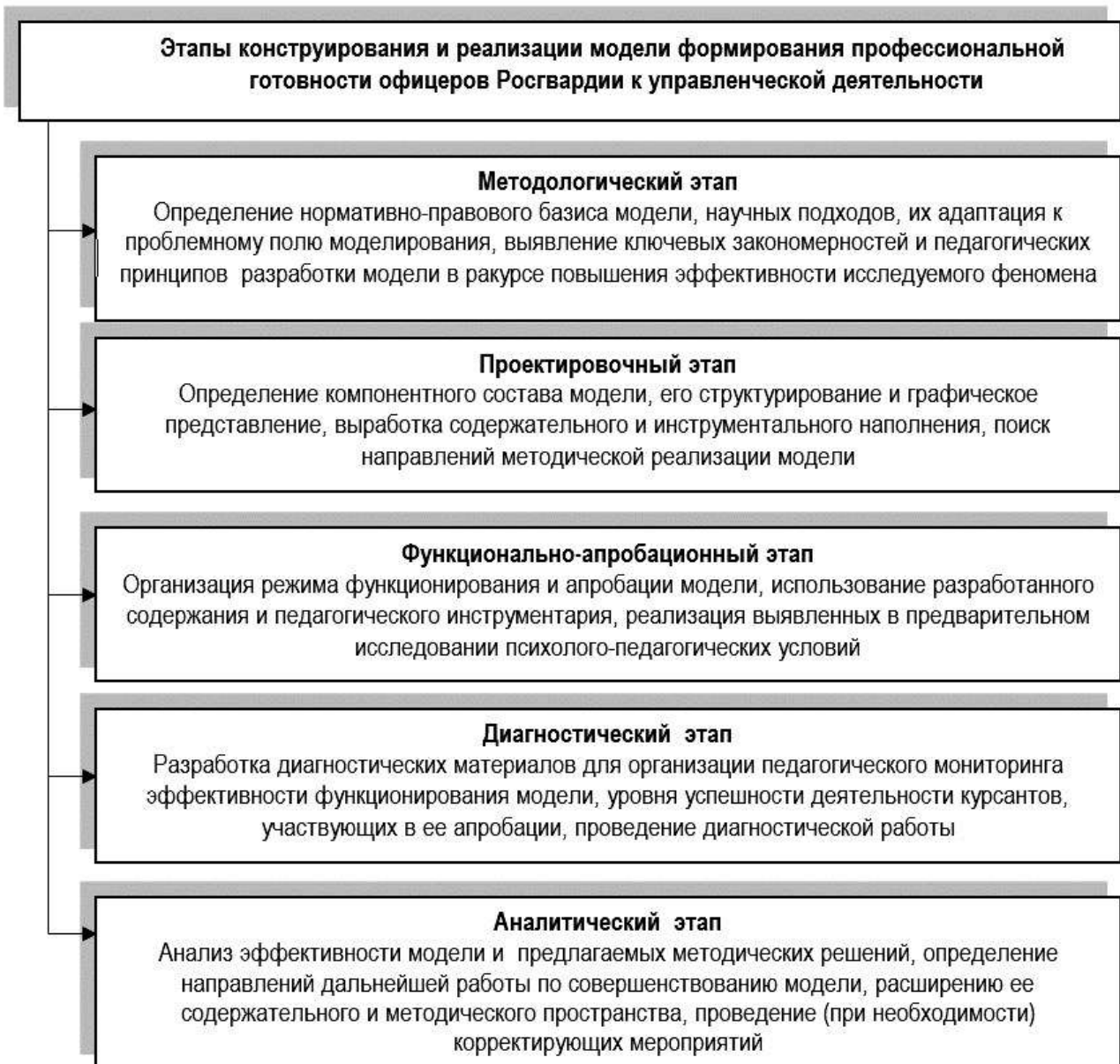
Рисунок 1 – Поэтапный алгоритм разработки и апробации модели формирования профессиональной готовности к управленческой деятельности