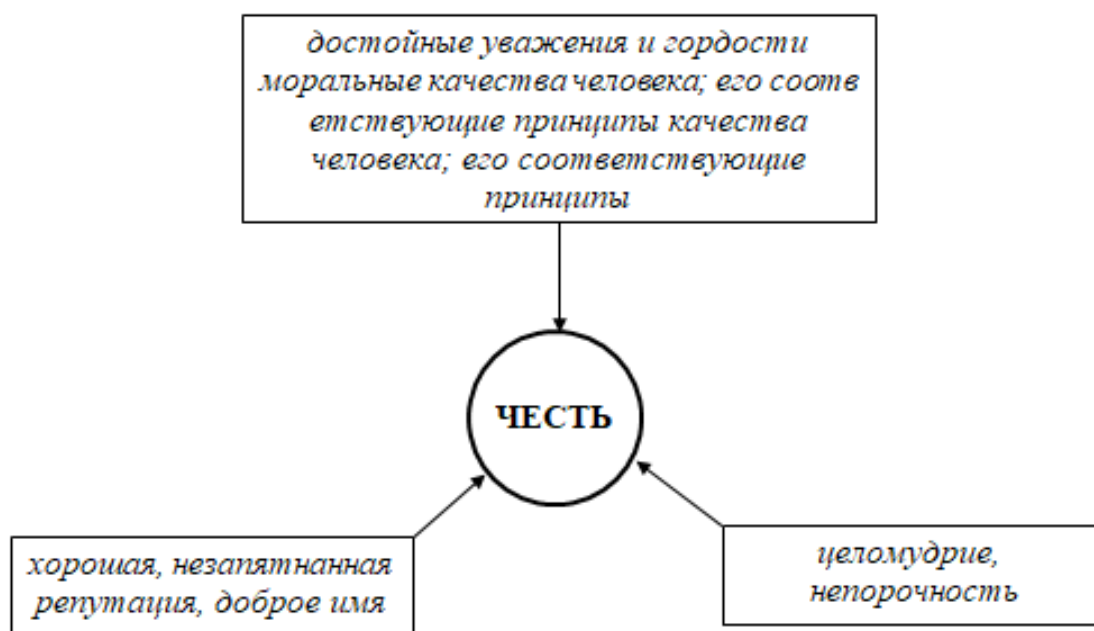
Рисунок 1 – «Честь» в соответствии с толковым словарем Ожегова

ющие характеристики не оставляют без внимания и понятие «офицерская честь», которые необходимо учитывать в качестве индикаторов при проведении эмпирических исследований для более детального практического изучения данного явления. Соответствующее понятие сегодня довольно слабо изучено и концептуально не закреплено в социологической мысли. Для преодоления последнего нами рассмотрены различные авторские подходы, изучающие вопросы офицерской чести.